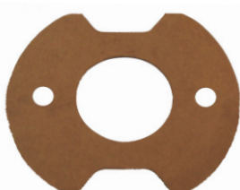
A-59 PORTA CARBÓN FORD + TROQUEL