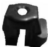
A-78 PORTA CARBÓN INDIEL, MARELLI