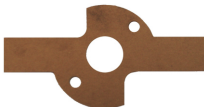
A-60 PORTA CARBÓN FORD + TROQUEL