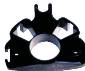
A-70 PORTA CARBÓN PARÍS R