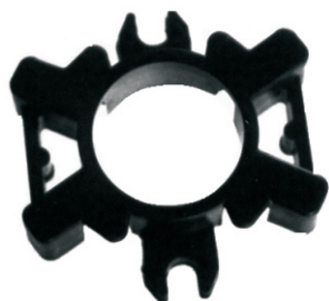
A-71 PORTA CARBÓN MOTORCRAFT