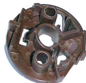
A-61 PORTA CARBÓN VALEO