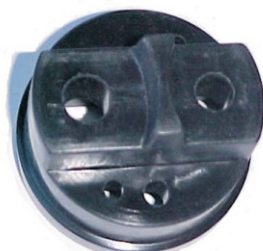
A-03 A.N. FORD DIESEL