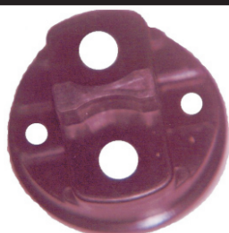
A-74 MITSUBISHI CHICA