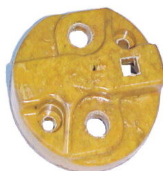
A-47 MICARTA WACSA