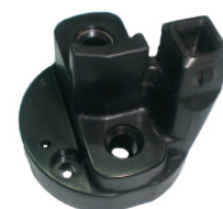
A-93 HITACHI CON ENCHUFE