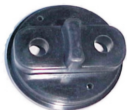
A-02 DUNA, SAVEIRO, BMW