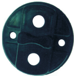
A-66 MITSUBISHI GRANDE