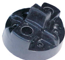
A-27 A.N. 115, 12w 24w