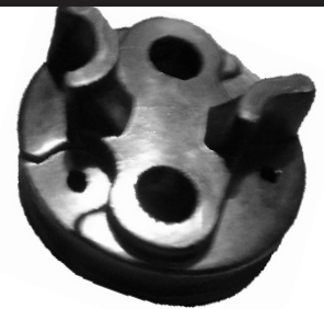
A-65 DELCO REMI