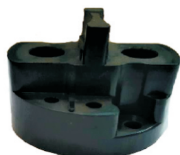
A-127 TAPA MITSUBISHI PARA ARRANQUES PESADOS