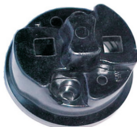
A-28 CABEZAL TAUNUS