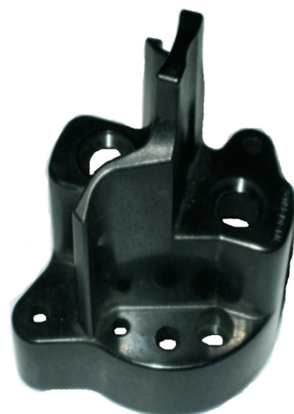
A-176 TAPA INDIEL PARA ARRANQUE PESADO