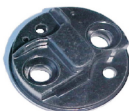
A-25 CHEVROLET BAJA