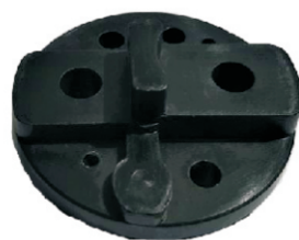
A-128 TAPA DELCO REMY MT 28