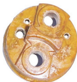
A-45 NASHVILLE, BRASIL MICARTA