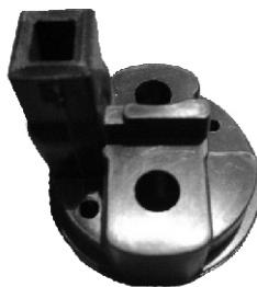
A-72 INDIEL CON ENCHUFE