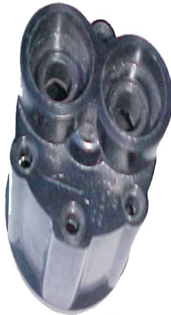
A-58 FIAT 619