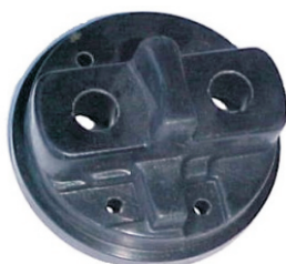
A-31 ARGELITE, RENAULT MICARTA