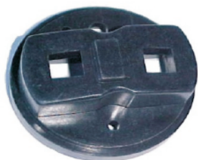
A-44 PEUGUEOT, RENAULT