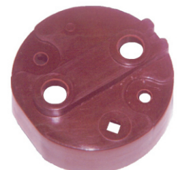
A-73 TAPA APACHE