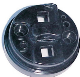
A-38 GACEL, SIERRA, RENAULT