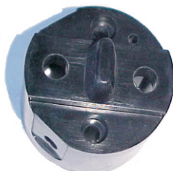
A-17 TRIA GACEL