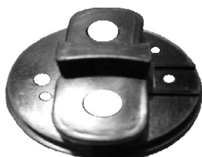
A-125 BOSCH INICION PALA TORNILLO HEXAGONAL