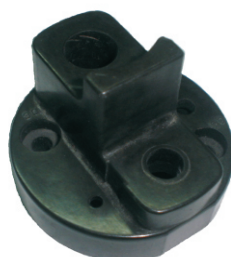
A-84 HITACHI ALTA