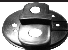
A-126 BOSCH INICION PALA DZE TORNILLO LATERAL HEXAGONAL