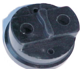
A-09 MOTOR CRAF, FORD