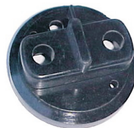
A-35 VALEO MICARTA