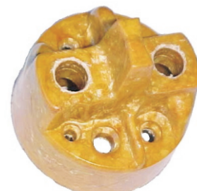
A-50 A.N 115 MICARTA