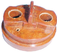
A-57 MICARTA SUPER TORQUE