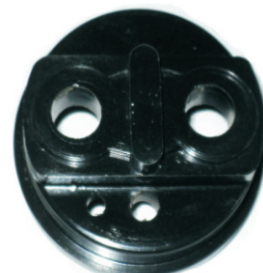
A-45 NASHVILLE, BRASIL BAQUELITA