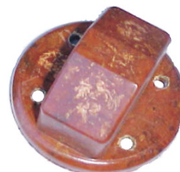
A-18 MICARTA RASTROJERO