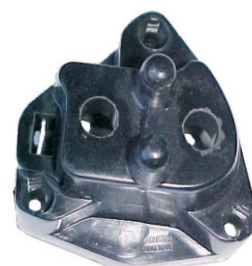
A-43 FIAT 1500 ALTA