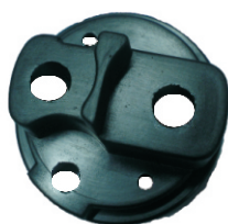
A-83 HITACHI CON ENCHUFE