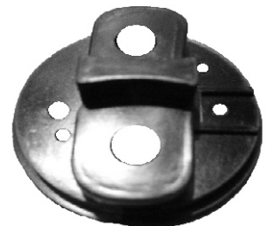
A-68 BOSCH INICIÓN PALA