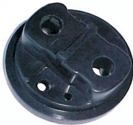
A-64 SPRINTER, MAXION