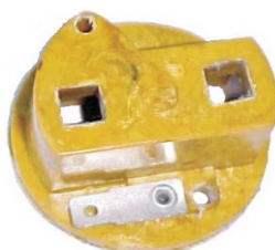
A-41 MICARTA IME