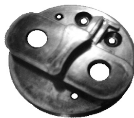
A-67 BOSCH INICIÓN TUERCA