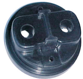
A-63 CABEZAL HITACHI