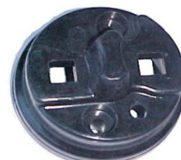
A-26 RENAULT TS