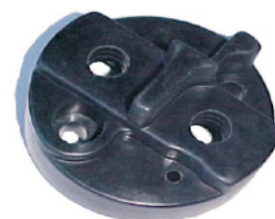
A-29 FIAT MARELLI